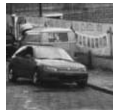
Gobierno local tiendan a reducir la delincuencia.

La tarea es lograr que las actividades del gobierno local tiendan a reducir la delincuencia. Esto requerirá volver a ajustar y a integrar las funciones, poner a los departamentos del gobierno local a trabajar en conjunto y considerar en sus actividades los principios de prevención de la delincuencia y la violencia.