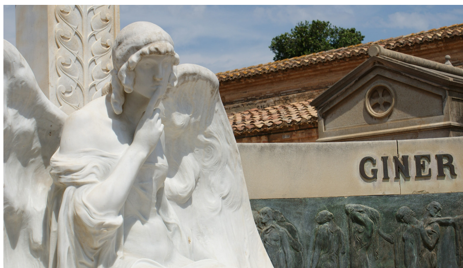
Imagen 15. Detalle del monumento de la Familia Giner, realizado por Vicente Navarro. Sección 1ª Derecha.

Como hemos mencionado anteriormente, se propone también el diseño de una página web, que podría llamarse "Museo del Cementerio General de Valencia". En esta web, aparte de información sobre las rutas de visita y los bienes incluidos, se podría publicar toda la información relativa al proyecto. También podrían incluirse otras secciones, como un apartado de contacto, un apartado de noticias y actividades, y una galería de fotos.