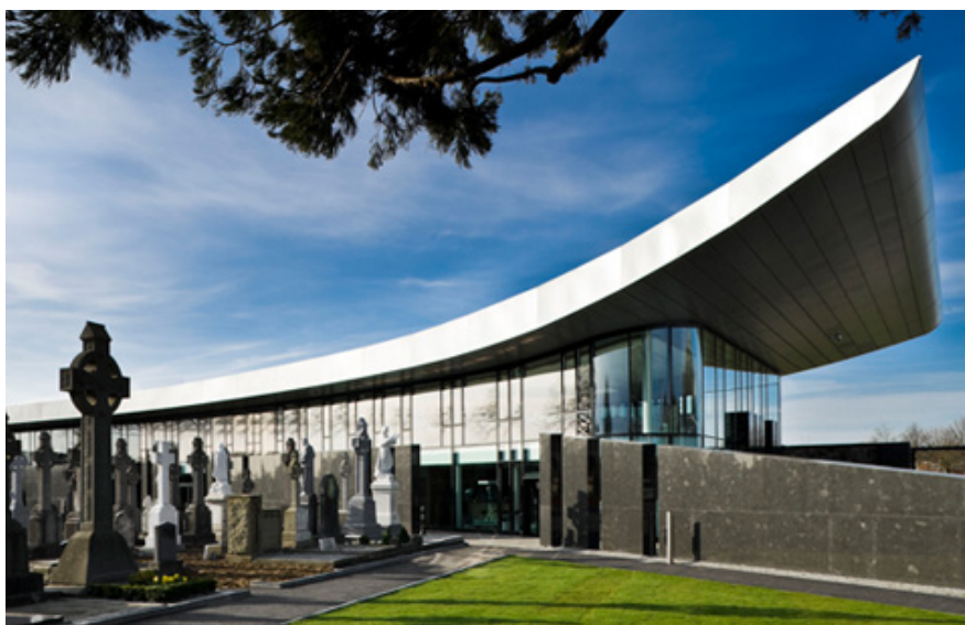
Imagen 9. Cementerio de Glasnevin, en Dublin.

También destaca a este respecto la Comunidad de Asturias: a raíz del proyecto “Cementerios Europeos, Jardines de Almas, Diversidad y Patrimonio”, cofinanciado por la Comisión Europea, se procedió a transformar en 2012 el Cementerio Municipal de La Carriona (Avilés) en un museo. La institución buscaría promocionar a los cementerios como “ los museos al aire libre más grandes que tienen las ciudades ” y no como espacios de muerte y oscuridad” 36 .