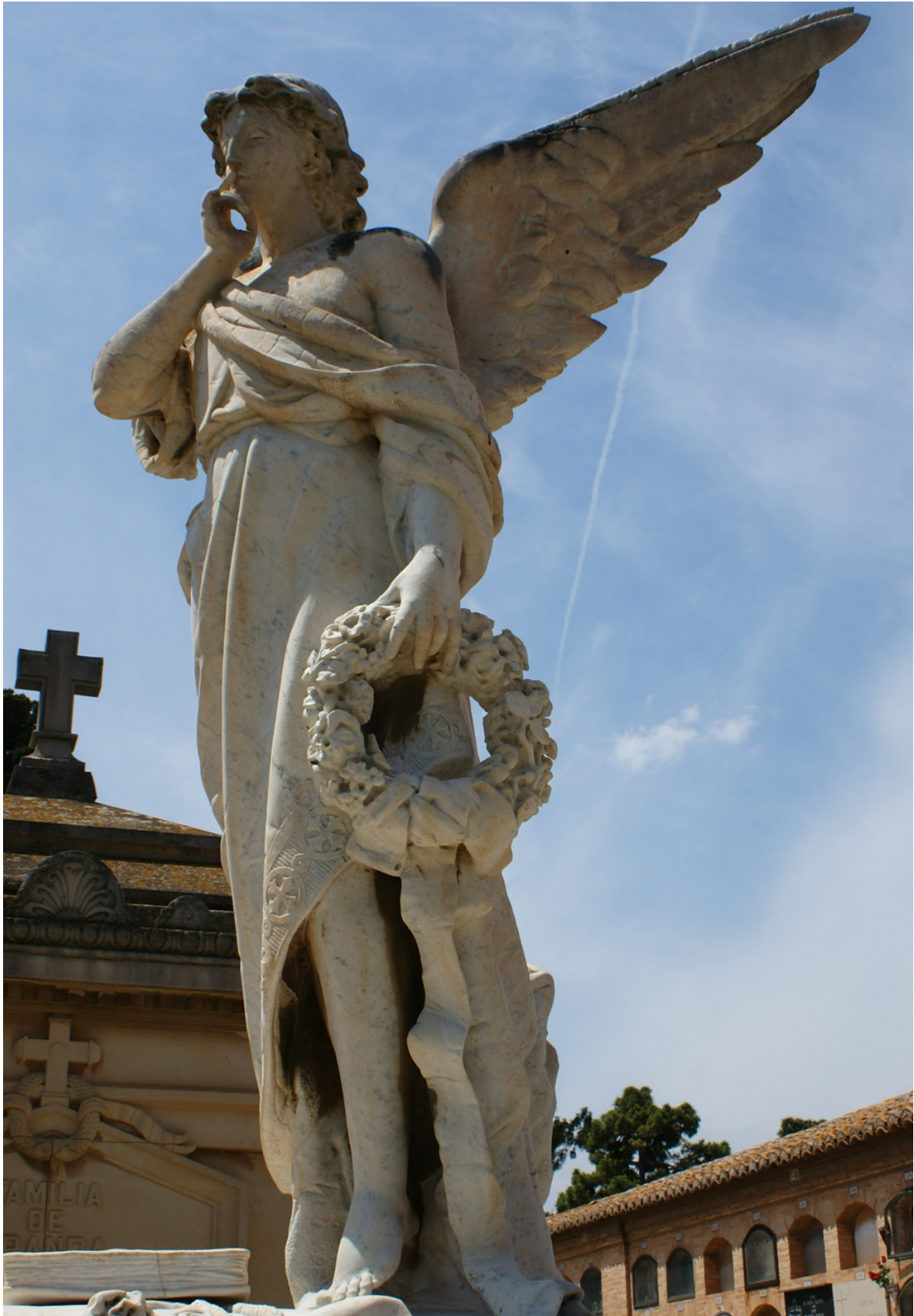
Imagen 4. Escultura de la tumba de la Familia Burriel. Sección 1ª Izquierda.