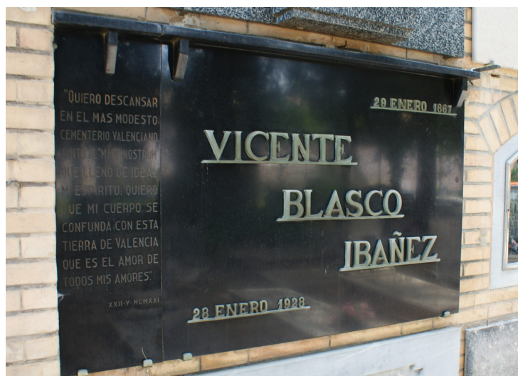
Imagen 6. Tumba del escritor Vicente Blasco Ibáñez. Cementerio Civil, sección 4ª Izquierda.