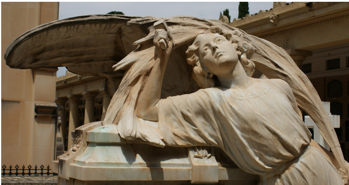
Imagen 11. Detalle de la decoración escultórica de la tumba de Fabregat Peris, realizada por Eugenio Carbonell. Sección 3ª Izquierda.

Otro aspecto más a tener en cuenta, es que gran parte de los ciudadanos desconoce el patrimonio del cementerio; éstos asisten al camposanto para visitar la tumba de familiares o personas cercanas. Además, la falta de musealización del espacio y la profusión de tumbas han dificultado en gran medida una adecuada identificación de los bienes culturales del cementerio.