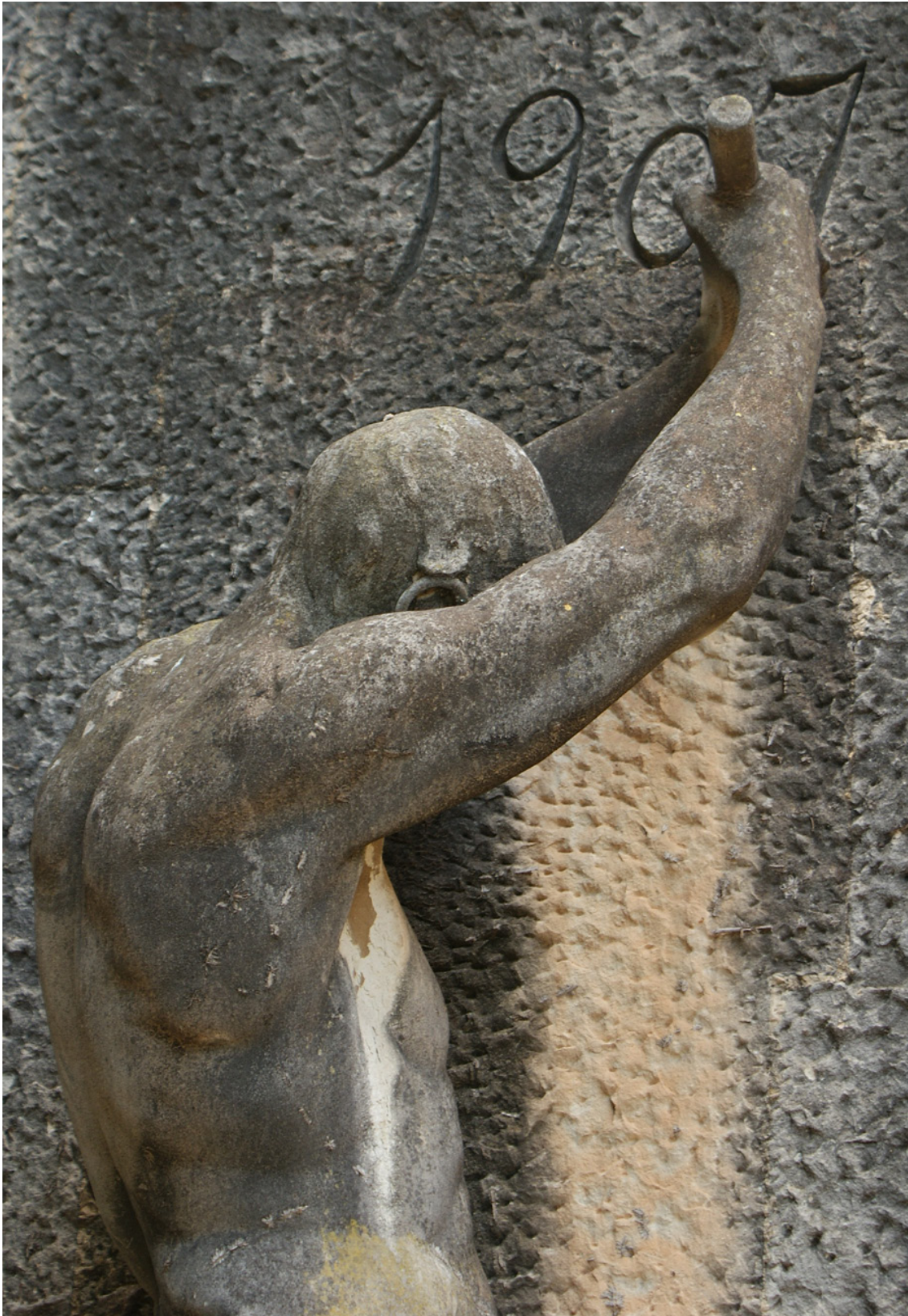
Imagen 17. Detalle del monumento de Alfredo Calderón (1907), Cementerio Civil, sección 4ª Izquierda.