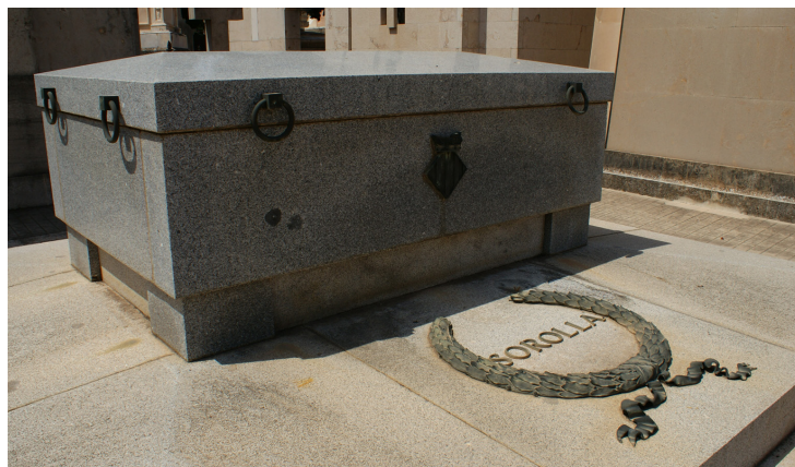
Imagen 5. Tumba del pintor Joaquín Sorolla y Bastida. Sección 1ª Derecha.