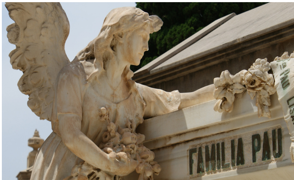
Imagen 14. Detalle de la tumba de la Familia Pau. Sección 1ª Derecha.

Con respecto a la vigilancia de estos bienes, se plantea la instalación de cámaras y la creación de puestos de vigilancia para evitar el expolio, asegurando que el recinto quede vigilado durante las 24 horas del día.