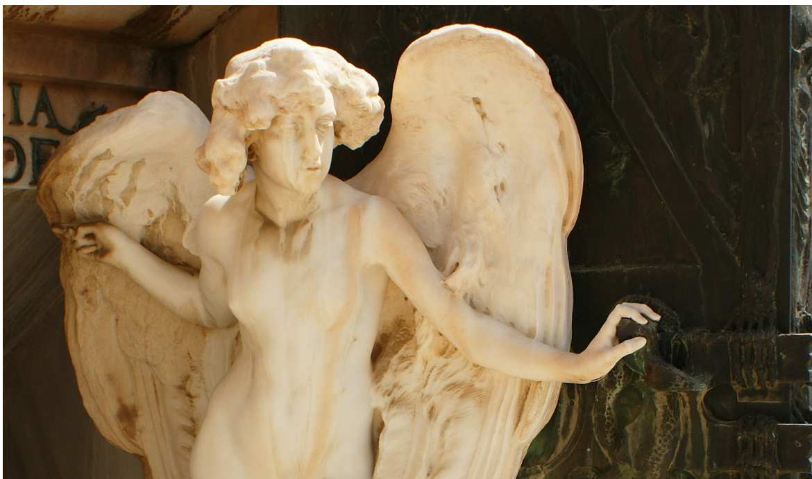
Imagen 18. Detalle de la decoración del Panteón de la Familia Moróder, de Mariano Benlliure. Sección 1ª Derecha.

La cuarta y última línea de actuación futura, muy relacionada con este trabajo, sería la realización de un proyecto museográfico mucho más preciso para el Cementerio General de Valencia, donde se pudieran contemplar la viabilidad de las propuestas expuestas, y la mejora de las mismas a corto, medio y largo plazo.