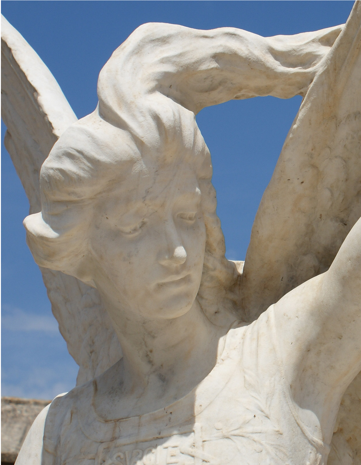
Imagen 19. Detalle de la decoración escultórica del panteón de la Familia Olmos-Burgos. Sección 1ª Derecha.