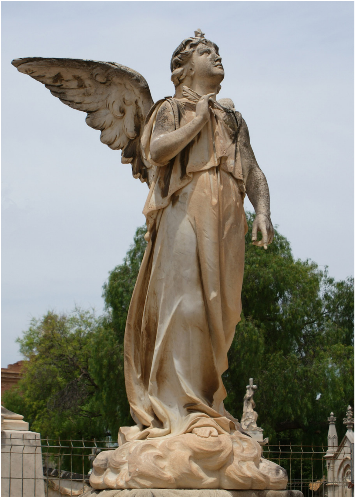
Imagen 13. Escultura de la tumba de la Familia Vitella (1879).