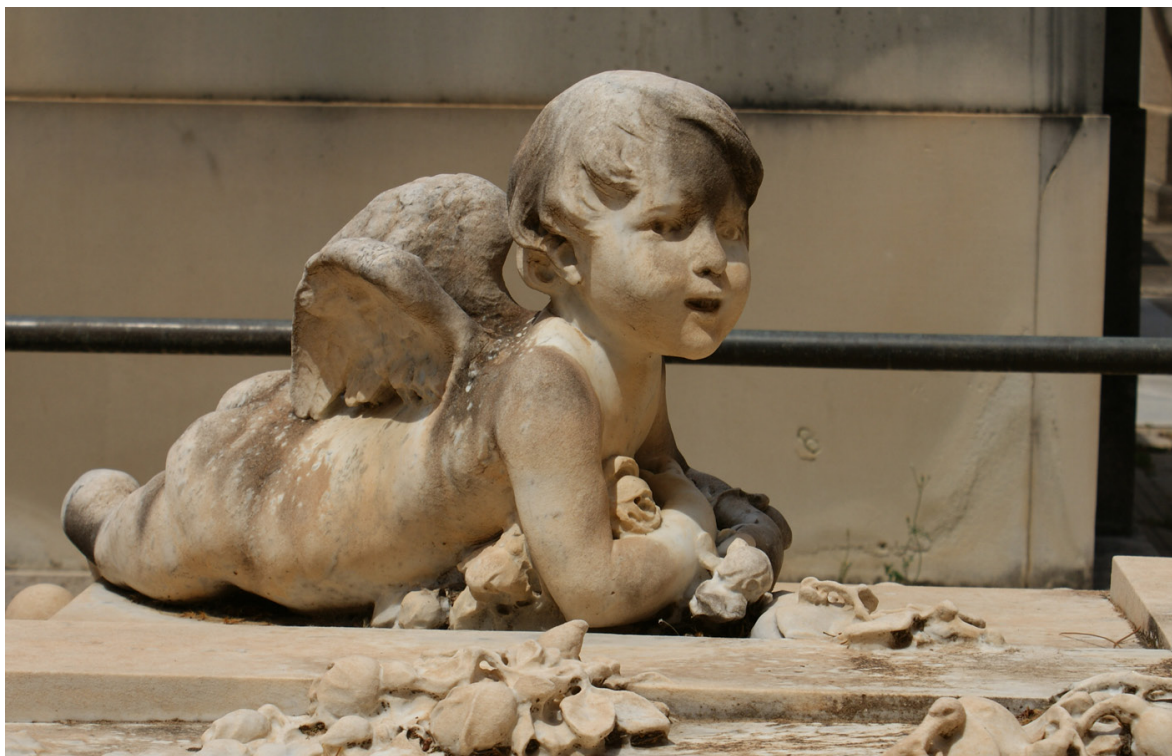
Imagen 12. Detalle de la decoración escultórica del panteón de Josefa Krause (1908), realizada por Teófilo García de la Rosa. Sección 3ª Izquierda.

Por último, es favorable la existencia de personal cualificado para conservar y dar a conocer los bienes: este proyecto supondría la creación de empleo para titulados universitarios en diversas disciplinas, como Historia, Historia del Arte o Conservación y Restauración de Bienes Culturales, cualificados para proteger y difundir el patrimonio del Cementerio General.