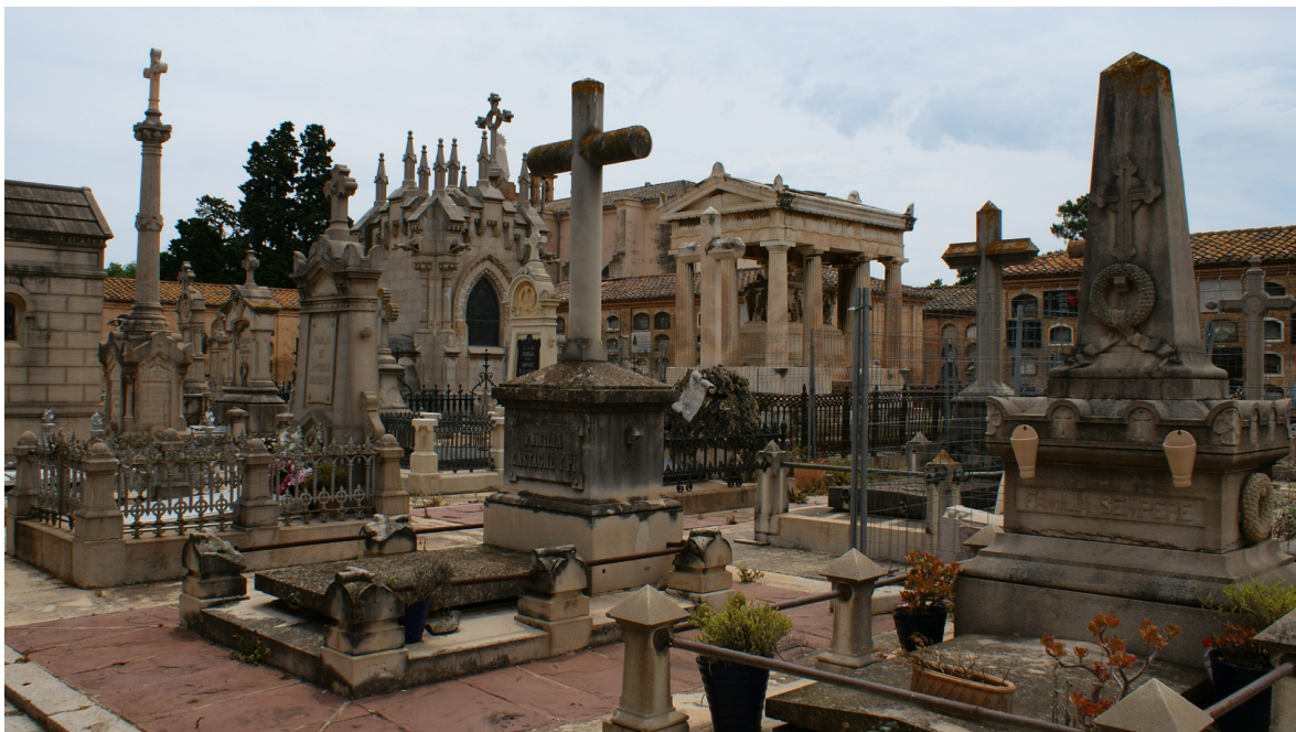
Imagen 2. Cementerio General, detalle de la sección 2ª Derecha.