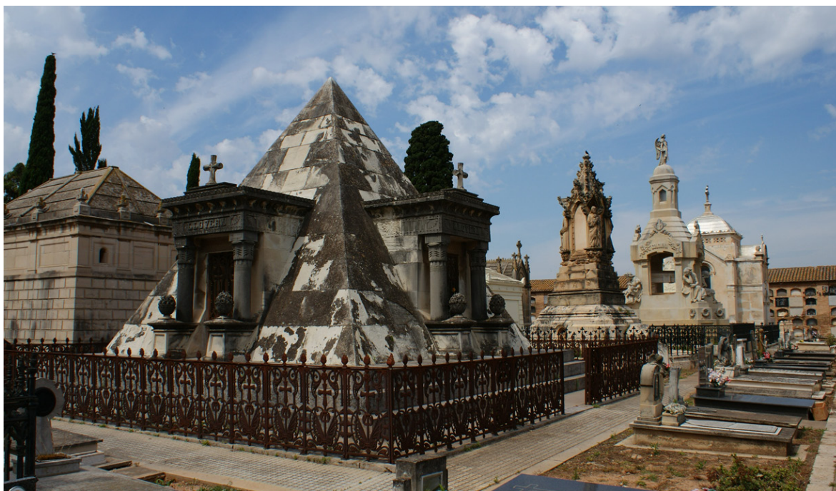
Imagen 3. Cementerio General, sección 1 a Izquierda.