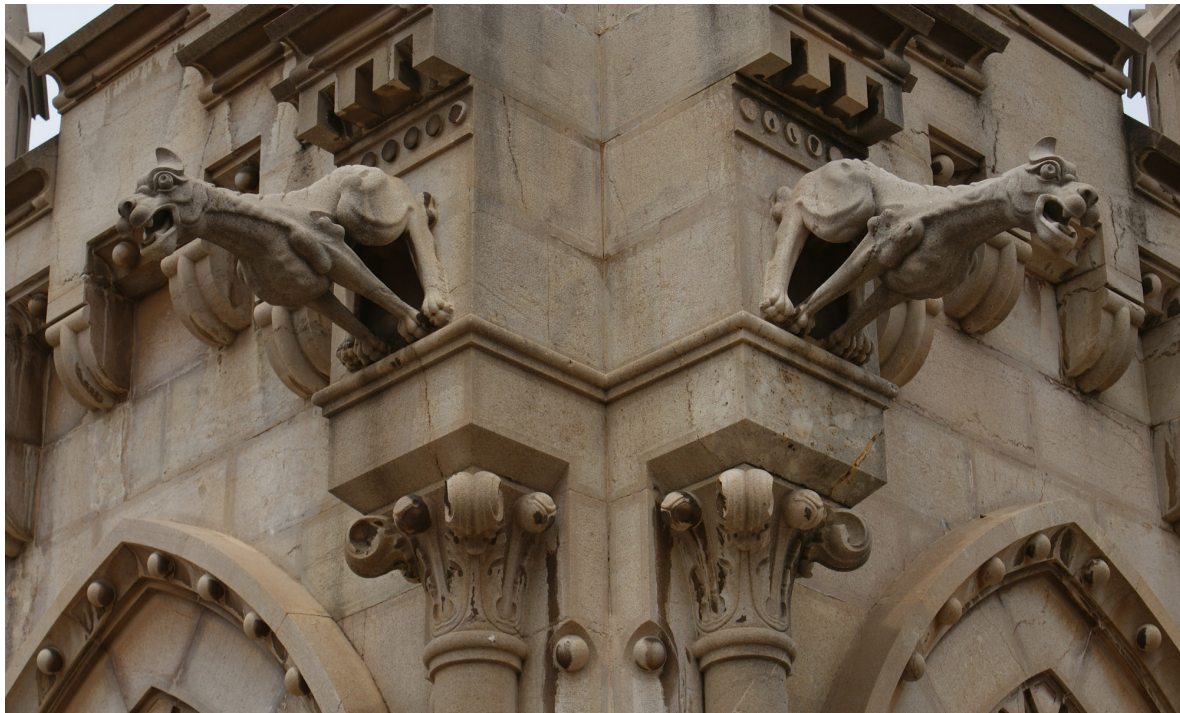
Imagen 10. Detalle del panteón Puchol y Sarthou (1896), del arquitecto J.M. Cortina. Sección 2ª Derecha.

En la siguiente tabla, exponemos el análisis DAFO desarrollado para evaluar las posibilidades de llevar a cabo un proyecto museográfico para el Cementerio General de Valencia.