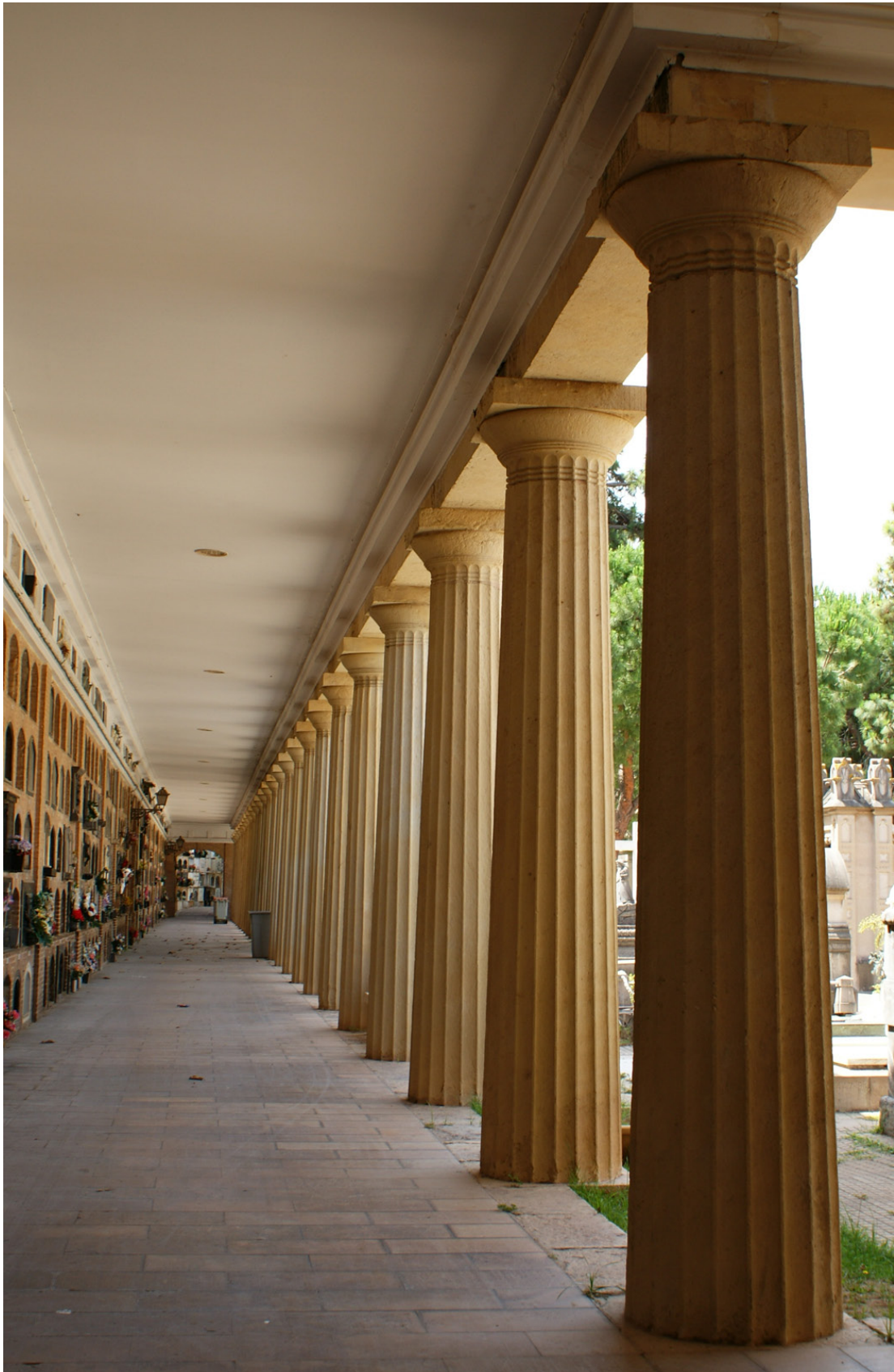
Imagen 8. Galería de Columnas, sección 3ª Izquierda.