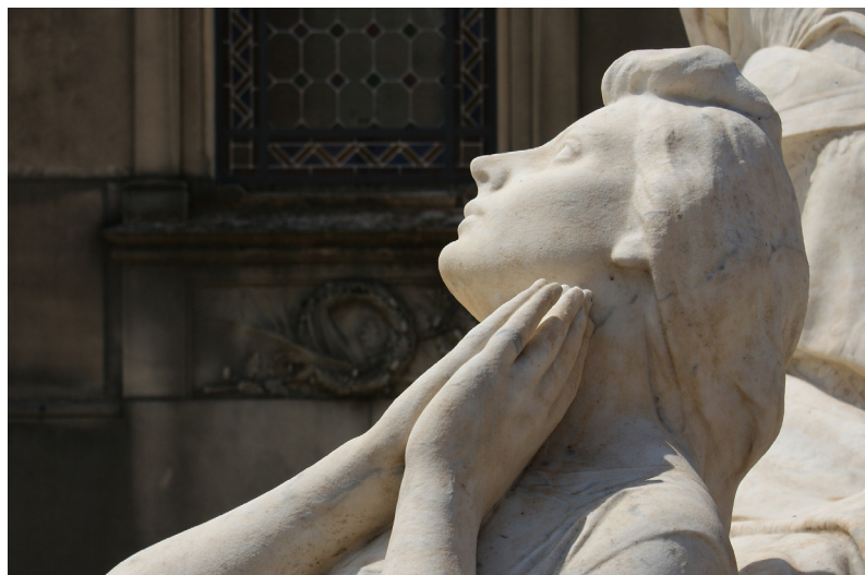
Imagen 16. Detalle de la decoración escultórica del monumento de la Familia Olmos-Burgos. Sección 1ª Derecha.

El convenio existente entre el Cementerio General y la Universidad Politécnica de Valencia para la restauración de los bienes, deja entrever el interés de ambas instituciones por la buena conservación del cementerio. La concentración de especialistas derivada de la realización de estas conferencias, puede incentivar el planteamiento de nuevos convenios de colaboración o de otras actividades que contribuyan a la conservación de este patrimonio.