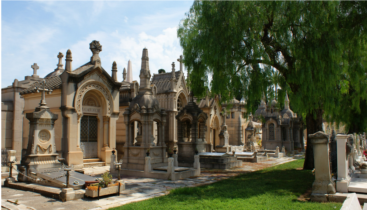
Imagen 1. Cementerio General, detalle de la sección 1ª Derecha.